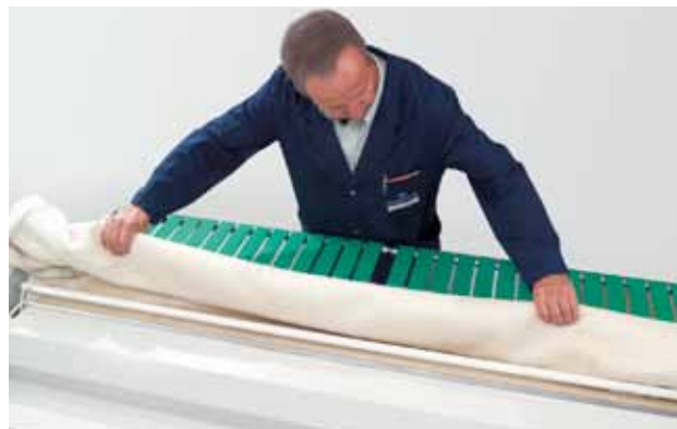
Un rivestitore di mangani Schulthess all'opera

I mangani che si trovano in perfette condizioni d'uso contribuiscono a farvi risparmiare denaro, poiché la biancheria viene trattata con delicatezza e può così mantenersi integra più a lungo. Il mangano conserva inoltre la propria efficacia e, con la nostra formula di abbonamento, potrete anche garantirne il funzionamento ininterrotto.