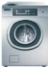
Spirit ProLine con interfaz multifuncional

Con la tarjeta Multi Wash Card se pueden almacenar hasta 20 programas específicos del cliente.