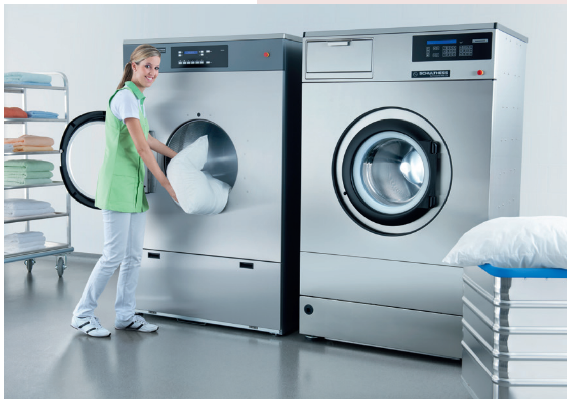
A Locarno saranno installate una lavatrice WMI 220 e un'asciugatrice TRI 9750 da 30 kg.

In Locarno kommen neu eine Waschmaschine von Typ WMI 220 und ein Trockner TRI 9750 30 kg zum Einsatz.