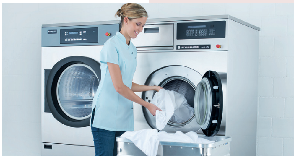
La nuova generazione di lavatrici Spirit Industrial WMI consente di migliorare il lavaggio professionale con una tecnologia intelligente e moderna e valori ecologici ottimizzati.

Die neue Waschmaschinen-Generation Spirit Industrial WMI verbessert das professionelle Waschen durch intelligente, moderne Technik und optimierte umweltfreundliche Werte.