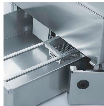
Wirtschaftlich, ökologisch und dank Flusenfilter auf einfachste Art zu reinigen: Das Wassereini-gungssystem von Schulthess.