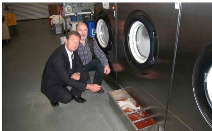
Der Rückgewinnungstank ist in der Sockelschublade integriert. Dieser erlaubt die mehrfache Verwendung der zum Beispiel mit Brandschutz oder mit Imprägniermitteln angereicherten Lauge.

Die In-House-Wäscherei sichert die hohe Qualität und steigert die Flexibilität. Darüber hinaus kann bei Bedarf täglich gewaschen werden. So können die Textilien unmittelbar nach Gebrauch wieder zum Einsatz kommen. Somit ist keine doppelte Lagerhaltung notwendig, was dazu führt, dass