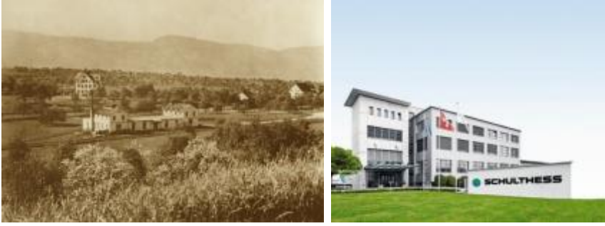
Wäschepflege Swiss made: Schulthess-Standort in Wolfhausen ZH 1917 und 2017