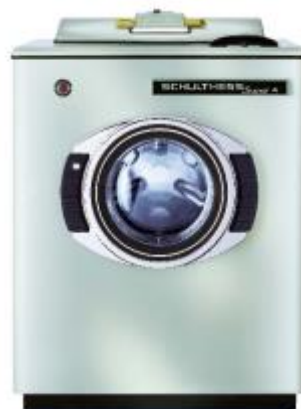
Schulthess Super 4