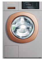
Ever Rose 8520.2U2