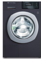
Titan Rock 8520.2U3