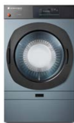
Versione in antracite