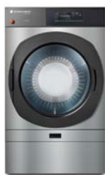
Versione in acciaio cromato