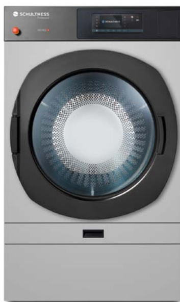
Versione in grigio opaco